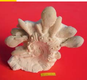
Seigel, Seeland, Stevns Klint