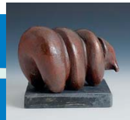
Birgit Kvorning – Fabeltier